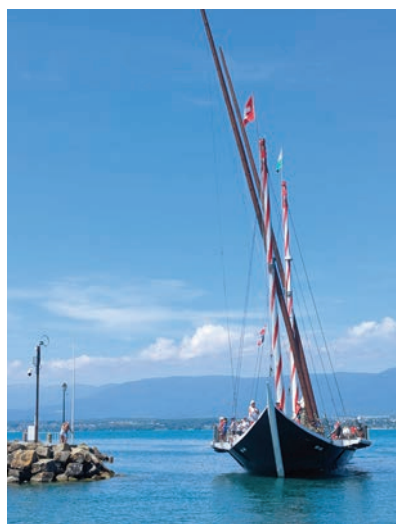
La Demoiselle entre dans le port, majestueuse