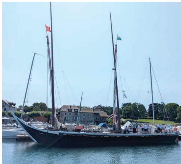
la Demoiselle au port

Précisons qu'une association, les « Voiles Latines du Léman » est chargée de réunir et de promouvoir les différentes barques du Léman existantes autour du lac. L'association coordonne également les grandes manifestations lémaniques auxquelles participent les six barques « Neptune », Vaudoise », « Savoie », « Demoiselle », la cochère « Aurore » et la galère « la Liberté », un patrimoine remarquable.