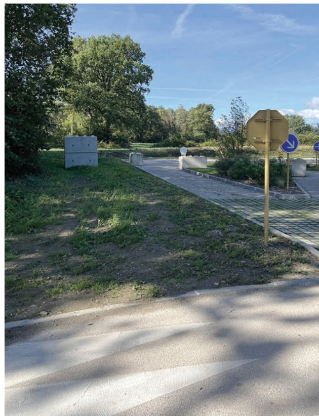
Des fossés rendus difficile à franchir