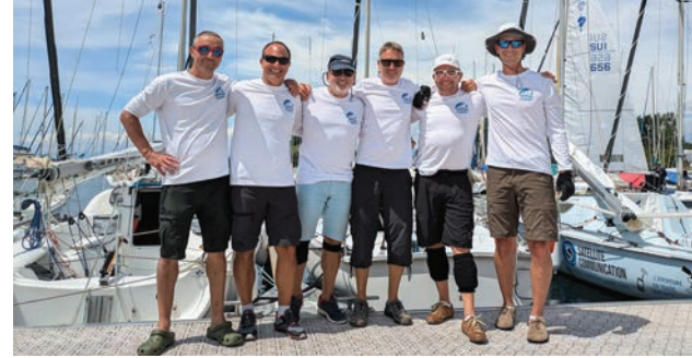
les 3 équipages du C2NY au 5 Jours du Léman

du C2NY qui représentaient à la fois la France et le Club, une épreuve difficile, sans escale, ni arrêt ou assistance, 5 jours et 5 nuits de navigation, sans oublier le traditionnel match retour organisé par le C2NY à Nernier, le 2 juillet dans le cadre des régates du mardi .