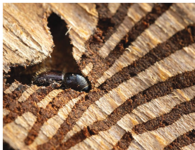
Le scolyte (Scolytinae)

Chaque année, l'alerte est donnée sur la disparition accélérée des oiseaux des jardins. Quelques décisions simples peuvent aider à la freiner. Ainsi, la Ligue pour la Protection des oiseaux, la LPO recommande de ne plus tailler les haies, ni élaguer les arbres dès le début du printemps début avril et d'attendre l'envol des oisillons, soit au plus tard fin août. Les tailles de haies et l'élagage des arbres se pratiquent avant la montée de sève, idéalement pendant les mois de novembre et décembre. lpo.fr