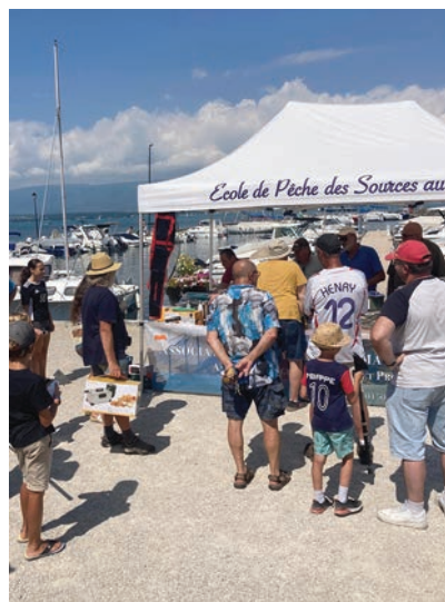
Le concours de pêche a eu lieu sur le quai des Dériveurs

Ce beau moment s'est terminé avec le verre de l'amitié offert par la commune.