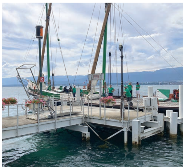
la Savoie amarrée au port de Nernier